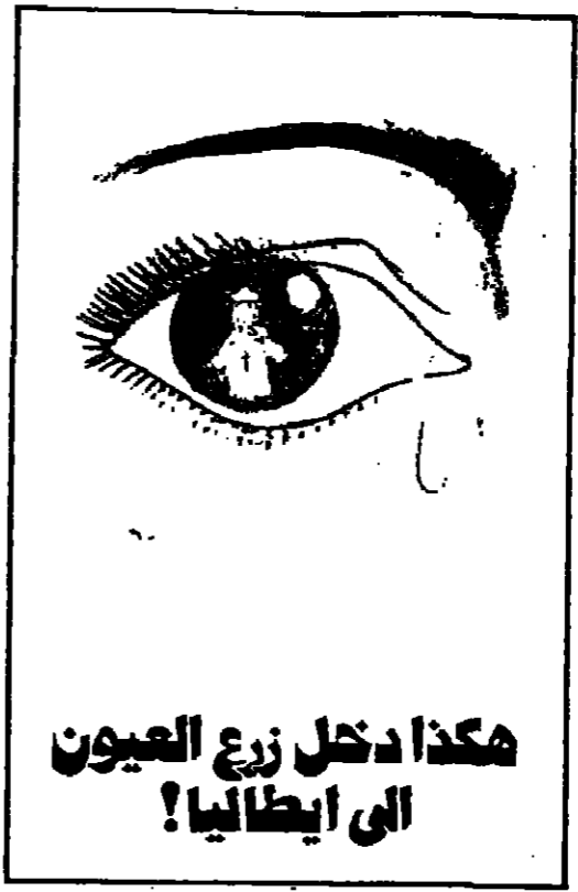
هكذا دخل زرع العيون الى إيطاليا!